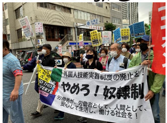
技能実習制度廃止全国キャラバン：東京 200 人もの支援者や実習生が参加し、外国人保護を訴える声飛び交いました